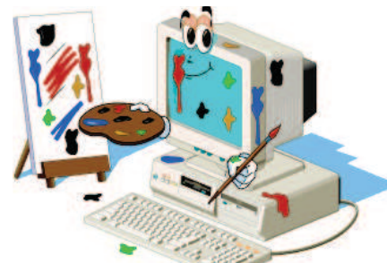
Εικόνα 3 Πρόγραμμα Σχεδίασης

Η επεξεργασία που αναφέραμε πιο πάνω πραγματοποιείται με τον υπολογιστή να παίρνει μία μία τις εντολές από το πρόγραμμα και να τις εκτελεί, πάντοτε με τη σειρά, με τον ίδιο τρόπο κάθε φορά.