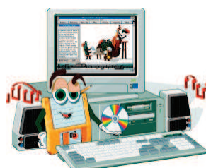
Εικόνα 1 – Ένας Ηλεκτρονικός υπολογιστής

Είναι μια μηχανή που έχει τη δυνατότητα να επεξεργάζεται, αποθηκεύει και μεταδίδει πληροφορίες με μεγάλη ακρίβεια και ταχύτητα , σύμφωνα με τις εντολές (οδηγίες) που της δίνει ο άνθρωπος μέσα από ένα πρόγραμμα .